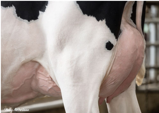
TERRA-LINDA MGNM FIERCE DAM