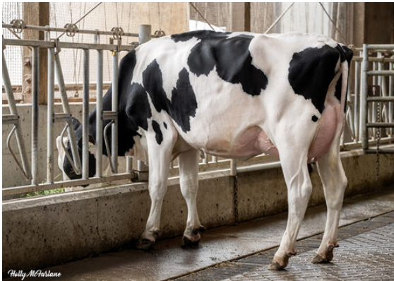
TERRA-LINDA MGNM FIERCE DAM